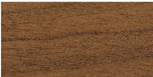
F07 american walnut