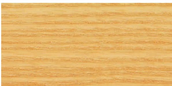
F09 Ashwood (ash-wood natural)