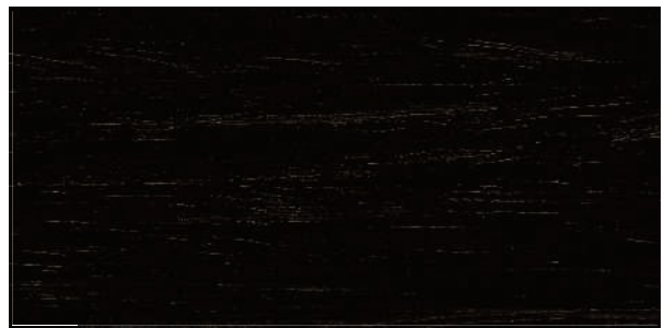
F04 wenge (alpi wenge stained)