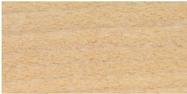
B42 white transparent